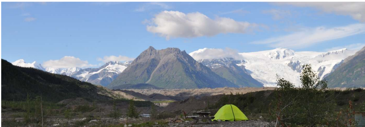
Kanada und Alaska. Wälder, Seen, Berge, Gletscher, Schöne Landschaften, unendliche Weiten, wenig Leute, Campieren in der Wildnis – Erholung pur!

Es hatte sich gezeigt, dass eine gute Vorbereitung und gut arbeitende Personen eine solch lange Auszeit ermöglichen. Es konnten alle Aufträge den Kundenbedürfnissen entsprechend erledigt werden. Die Mandate bei der ProHolz Thurgau und EDV-Arbeitsgruppe reduzierte ich auf ein Minimum, sodass ich meine Aufgaben vor und nach den Ferien erledigen konnte.